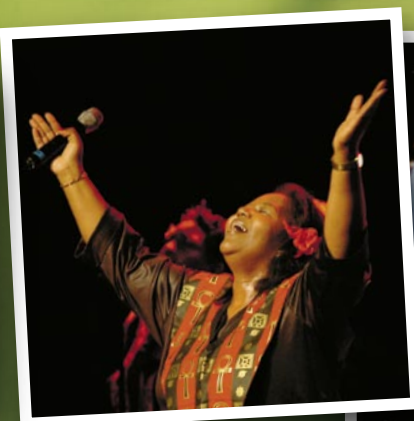
Angels in Harlem gospel choir