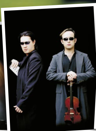
Igudesman en Joo